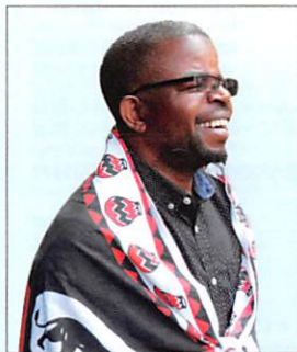
MBIRApayer Musekiwa Chingodza (ムセキワ・チンゴザ)

ムビラを先祖代々演奏してきた“チンゴザ一族”の末裔、“5歳にしてムビラの演奏をはじめた”と言われるムビラの名手。幼いころからショナ族の儀式でムビラを演奏し、青年期にはジンバブエの名門・プリンスエドワード校でムビラを教える。その類まれなる才能が海外のアーティストたちの注目を集め、世界で有名なムビラ奏者となる。今回、11月にフランスツアーをひかえる多忙なスケジュールの中、初来日する！